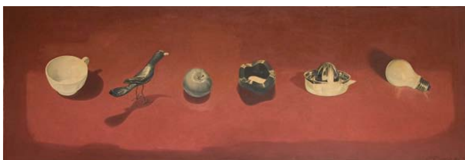
Juan Pablo Renzi. "Frase final" (1980)