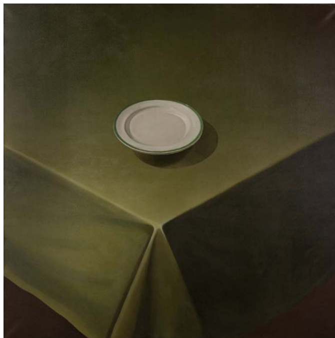
Juan Pablo Renzi. "El mantel verde" (1978)