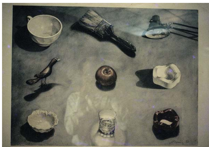
Juan Pablo Renzi. “Inventario 9” (1980)